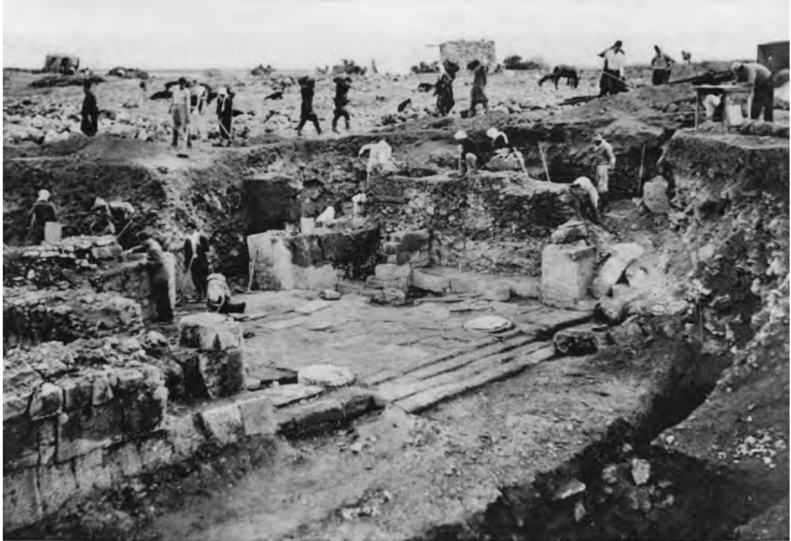
Fig. 2b : Vue de l'entrée du Palais royal d'Ougarit, en cours de dégagement (d'après Syria 1951). الشكل b2 : صورة لمدخل قصر أوغاريت الملكي. أثناء عملية الكشف (نقلًا عن مجلة Syria , 1951).