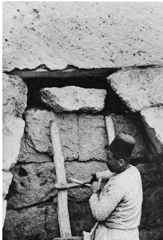
Fig. 2c : Détail de la poterne d'Ougarit avant l'enlèvement du mur qui l'obstruait (d'après Syria 1951). الشكل c2 : صورة مفصلة للباب السري في أوغاريت قبل إزالة الجدار الذي يستتره (نقلًا عن مجلة Syria , 1951).

Pour conclure brièvement cet historique, nous ne connaissons, jusqu'à récemment, que très peu l'architecture palatiale du Bronze récent en Syrie occidentale. Le Palais royal d'Ougarit et celui du niveau IV de Tell Atchaneh-Alalakh étaient les seuls exemples connus d'architecture palatiale de cette période. Depuis, avec le développement des travaux à Ras Ibn Hani et à Tell Kazel-Sumur, nous possédons d'autres témoignages de type palatial et nous pouvons ainsi mieux définir les caractéristiques de l'architecture palatiale qu'Ougarit illustre, de manière exceptionnelle, par les dimensions de l'édifice, son système d'organisation et la nature des objets retrouvés (objets de luxe et tablettes).