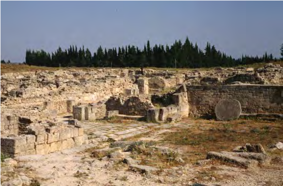
Fig. 2d : Vue actuelle de l'entrée du Palais royal d'Ougarit. الشكل d2 : صورة حالية لمدخل القصر الملكي في أوغاريت.