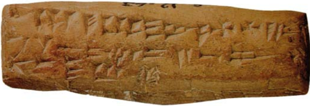
Fig. 5a : La tablette RS 12.063, retrouvée à l'entrée du Palais royal d'Ougarit, présente la séquence complète de l'alphabet cunéiforme d'Ougarit, de trente signes (Damas, 3561).

L'exposition présentée actuellement, dans le cadre de la coopération entre la mission archéologie syro-française de Ras Shamra - Ougarit et le Musée national de Damas, concerne les découvertes faites dans le Palais royal d'Ougarit. La majorité a été sélectionnée parmi les collections stockées dans les réserves du musée, qui sont exceptionnellement montrées au grand public. La restauration de certaines œuvres, tel le chaudron en bronze (RS 16.392) découvert dans le puits de la cour I, a été programmée à cette occasion. Ainsi, grâce au travail du Laboratoire de restauration de la Direction des Antiquités et des Musées de Syrie, cet objet, unique à Ougarit, peut aujourd'hui être exposé pour la première fois.