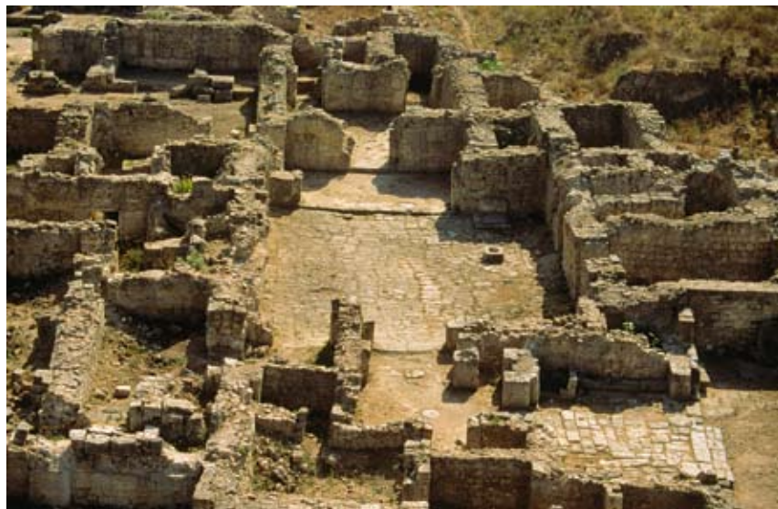
Fig. 7b : Vue aérienne de la partie occidentale du Palais royal d'Ougarit. Au premier plan, l'entrée de l'édifice, puis la cour I dallée, le locus 72 et la salle de trône. الشكل b7 : صورة جوية للجزء الغربي من قصر أوغاريت الملكي. في مقدمة الصورة مدخل الصرح، ثم الفناء I المبلط والموضع 72 وقاعة العرش.