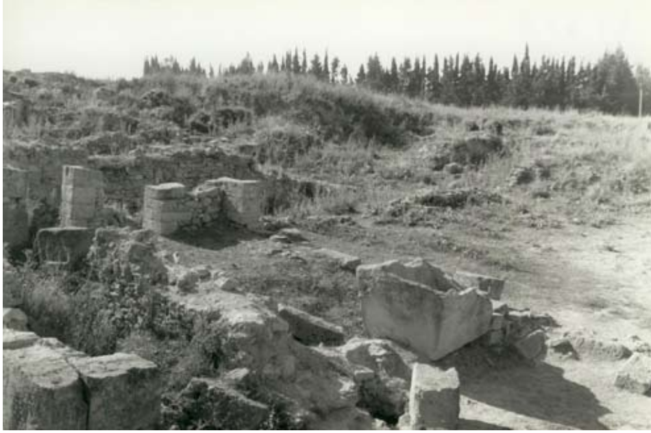
Fig. 10g : Puits et auge du jardin 148 du Palais royal d'Ougarit. الشكل 10g : بئر وجرن الحديقة 148 في قصر أوغاريت الملكي.