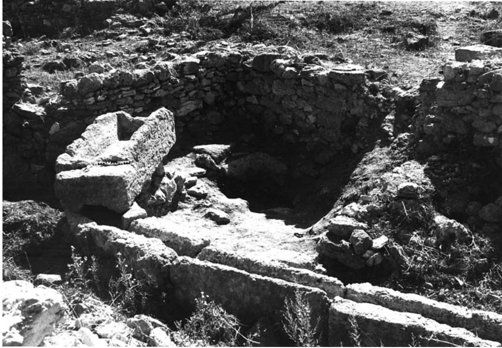
Fig. 10e : Puits alimentant le bassin de la salle d'agrément ( locus 153, « ex-cour V »). الشكل e10 : بئر يزود بالماء حوض قاعة الولايم (الموضع 153, «الفناء السابق V»).