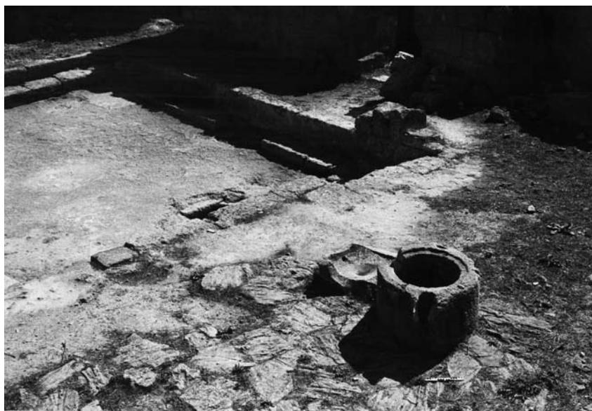
Fig. 10b : Puits et auge de la cour au bassin (locus 153, « ex-cour V »).

الشكل a10 : صورة للجهة الغربية من الفناء المبلط في الموضع 128 (الفناء ا). مع بئر (في مقدمة الصورة) وجرن (في الخلف).