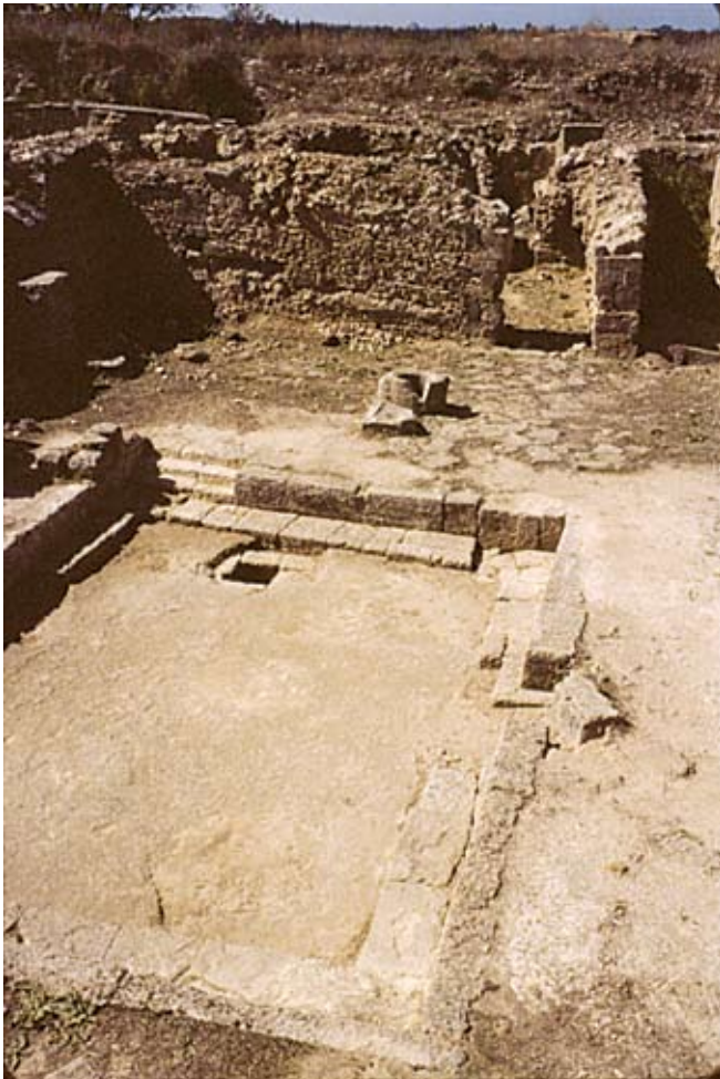
Fig. 10d : Le bassin de la salle d'agrément ( locus 153, « ex-cour V »). الشكل d10 : حوض قاعة الولائم (الموضع 153. «الفناء السابق V»).