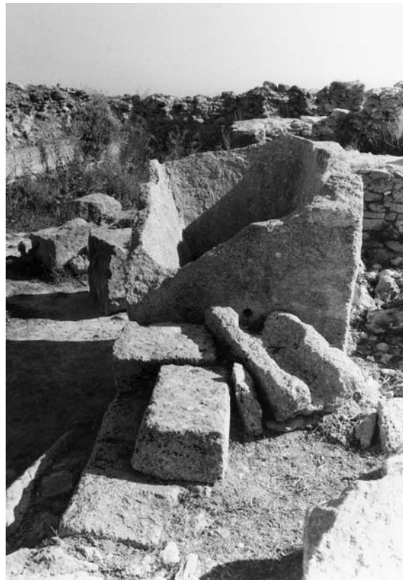
Fig. 10h : Auge et canalisation permettant probablement d'irriguer le jardin 148 du Palais royal d'Ougarit. الشكل 10h : جرن وقناة يسمحان على الأغلب بري الحديقة 148 في قصر أوغاريت الملكي.