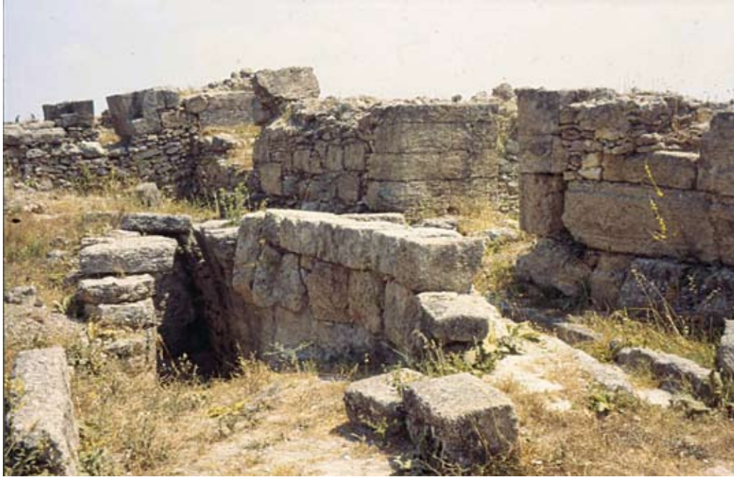
Fig. 10i : Entrée du grand collecteur de la place du Palais royal d'Ougarit. الشكل i10 : مدخل المجرور العام في قصر أوغاريت الملكي.