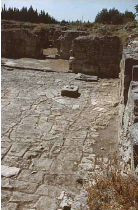
Fig. 10a : Vue de la partie occidentale de la cour dallée du locus 128 (« cour I »), avec puits (au premier plan) et auge (au second plan).

On peut donc constater que le Palais royal utilise à la fois les systèmes traditionnels d'alimentation, d'utilisation et d'évacuation des eaux habituels à Ougarit. Mais il comporte d'autres installations élaborées en fonction de ses besoins particuliers, en particulier celle du grand bassin de la salle d'agrément (153) et celle du jardin (148) qui visent toutes les deux au plaisir et à la détente.