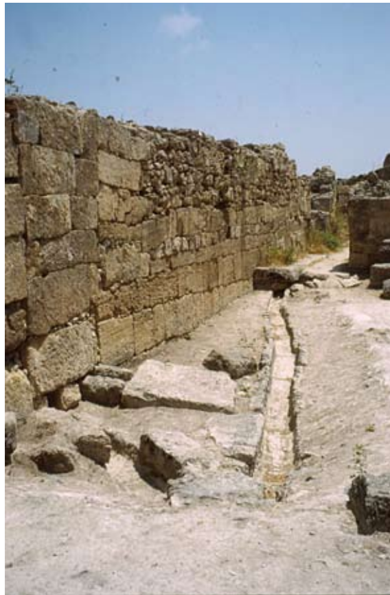
Fig. 10j : Canalisation et puisard de la salle d'agrément ( locus 153, « ex-cour V »). الشكل j10 : قناة وبلوعة قاعة الولايم (الموضع 153, «الفناء السابق V»).