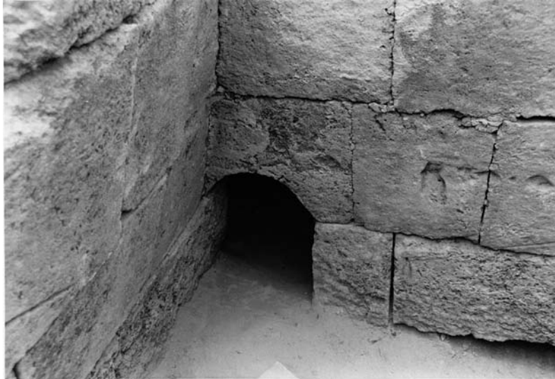
Fig. 13d : Ouverture aménagée à la base du mur septentrional de la tombe royale 204 du palais d'Ougarit. Elle servait probablement de « porte de communication » entre la sépulture et la terre (cliché, archives de la mission).

الشكل c13 : مر الدخول إلى القبور الملكية في قصر أوغاريت الملكي (صورة من محفوظات البعثة).