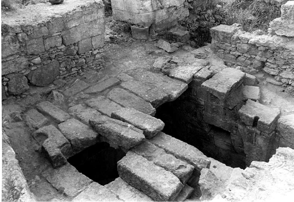
Fig. 13e : Vue de la tombe royal 205 du palais d'Ougarit. الشكل e13 : صورة للقبر الملكي 205 في قصر أوغاريت الملكي.