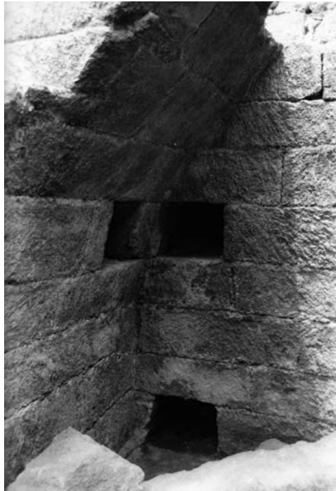
Fig. 13f : Vue de la chambre funéraire de la tombe royale 205 du palais d'Ougarit. Dans les murs sont aménagées plusieurs niches.

الشكل f13 : صورة للحجرة الجنائزية في القبر الملكي 205 في قصر أوغاريت. وقد بنيت في الجدران العديد من المشكايات.