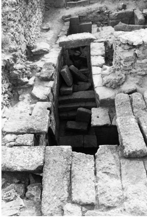
Fig. 13c : Le couloir d'accès aux tombes royales du palais d'Ougarit.

الشكل c13 : مر الدخول إلى القبور الملكية في قصر أوغاريت الملكي.