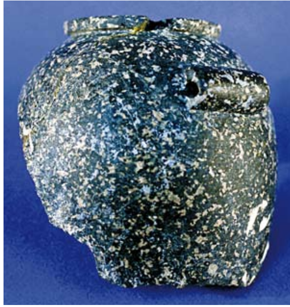
Fig. 29b : Vase égyptien en gabbro-diorite (RS 15.549, Damas), H. 10,5 cm, Palais royal d'Ougarit.

الشكل b29 : إناء مصري من الديوريت المحبب (RS 15.549. دمشق) الارتفاع 10,5 سم. قصر أوغاريت الملكي.