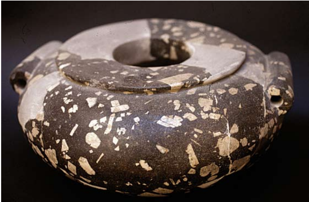
Fig. 29c : Vase égyptien en diorite (RS 15.195, Damas 4163), H. 15 cm, Palais royal d'Ougarit.

الشكل b29 : إناء مصري من الديوريت المحبب (RS 15.549. دمشق) الارتفاع 10,5 سم. قصر أوغاريت الملكي.