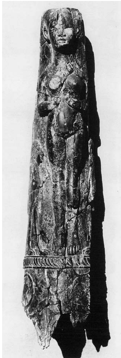
Fig. 32a : Olifant en ivoire d'éléphant (RS 16.404, Damas 7360), H. 60 cm, Palais royal d'Ougarit.

Les instruments de percussion sont, quant à eux, représentés par deux « claquoirs » dont l'un (RS 24.421, Musée national de Damas), découvert dans la maison d'un « prêtre-magicien » au sud du tell, a dû servir dans les rituels. Connus pour être des instruments de musique égyptiens, les claquoirs sont destinés à faire du bruit par leur entrechoc, pour chasser les mauvais esprits dans un contexte de magie et de rituel plutôt que des instruments de musique au sens musical du terme.