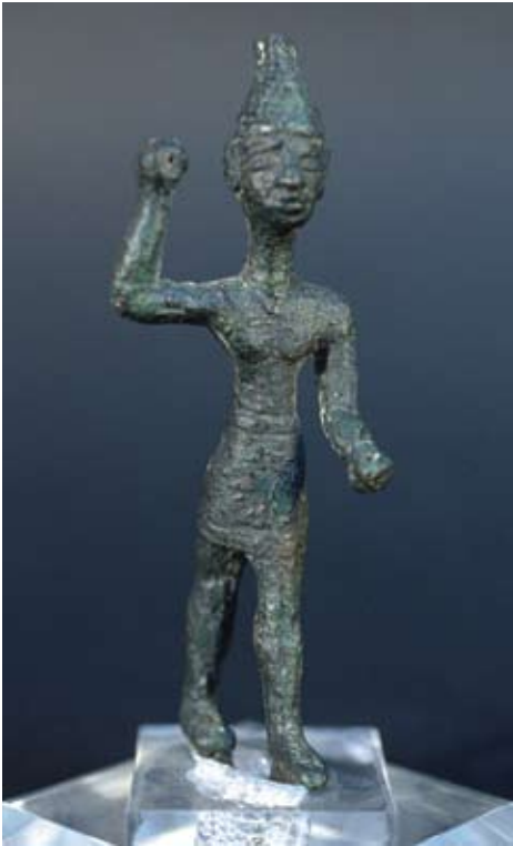
Fig. 39f : Figurine de Baal en bronze (RS 18.204, Damas), H. 11 cm, place entre le Palais royal et la Maison de Yabninu, Ougarit. الشكل f39 : دمية تمثل بعل من البرونز (RS 18.204, دمشق). الارتفاع 11 سم. من الساحة الواقعة بين القصر الملكي وبيت يابنينو. أوغاريت.