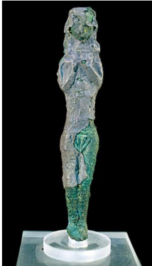
Fig. 39b : Figurine féminine en bronze plaqué d'argent (RS 18.210, Damas 4958), H. 12,2 cm, Ougarit (cliché V. Matoïan).

الشكل a39 : دمية مسطحة من الرصاص (RS 17.54, دمشق 4464). الارتفاع 4,4 سم. قصر أوغاريت الملكي (محفوظات البعثة).