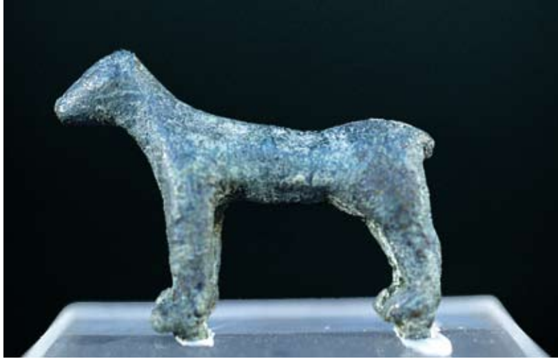
Fig. 39e : Figurine de quadrupède en bronze (RS 19.227, Damas 5172), H. 4,2 cm, Palais royal d'Ougarit. الشكل e39 : دمية رباعية الأرجل من البرونز (RS 19.227, دمشق 5172). الارتفاع 4,2 سم. قصر أوغاريت الملكي.