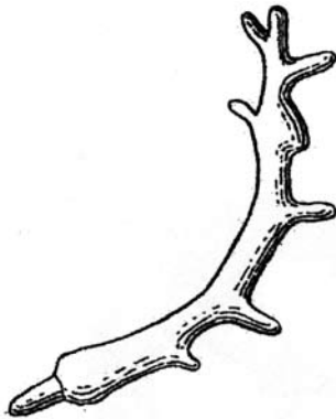
Fig. 39d : Élément de statuette en forme de bois de cervidé (RS 18.248, Damas 4959), bronze, H. 6,32 cm, Ougarit (archives de la mission).

الشكل c39 : «خشخيشة» برأس عنز بري من البرونز (RS 15.232). متحف دمشق الوطني. الارتفاع 14,8 سم. قصر أوغاريت الملكي (تصوير ف. ماتويان).