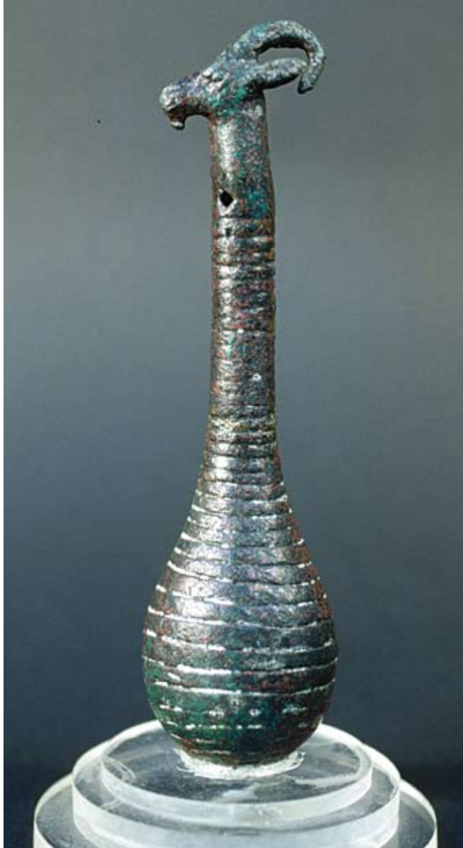
Fig. 39c : « Hochet » à tête d'ibex en bronze (RS 15.232, Musée national de Damas), H. 14,8 cm, Palais royal d'Ougarit.

الشكل c39 : «خشخيشة» برأس عنز بري من البرونز (RS 15.232). متحف دمشق الوطني. الارتفاع 14,8 سم. قصر أوغاريت الملكي.