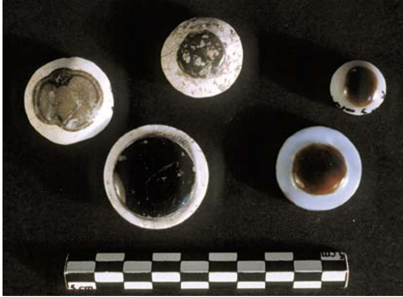
Fig. 41d : Une perle discoïdale (en haut, à gauche) et « yeux », en agate, Palais royal d'Ougarit. En haut, de gauche à droite, RS 15.328, RS 17.173, RS 17.167 ; en bas, de gauche à droite, RS 14.178, RS 17.172.

الشكل d41 : خرزة قرصية (في الأعلى. إلى اليسار) و«عيون» من العقيق. قصر أوغاريت الملكي. في الأعلى. من اليسار إلى اليمين. RS 15.328, RS 17.173, RS 17.167 . في الأسفل. من اليسار إلى اليمين. RS 14.178, RS 17.172.