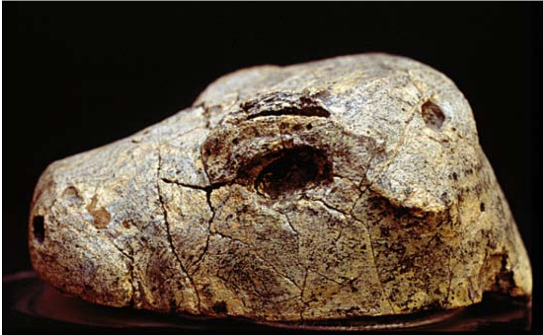
Fig. 41e : Tête de bovidé en matériau vitreux d'aspect marbré (RS 15.240, Damas), L. 12,45 cm, Palais royal d'Ougarit.

الشكل d41 : خرزة قرصية (في الأعلى. إلى اليسار) و«عيون» من العقيق. قصر أوغاريت الملكي. في الأعلى. من اليسار إلى اليمين. RS 15.328, RS 17.173, RS 17.167 . في الأسفل. من اليسار إلى اليمين. RS 14.178, RS 17.172.