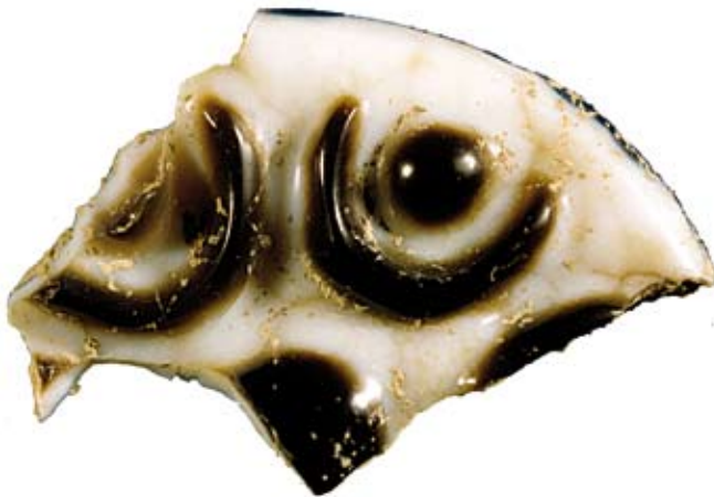
Fig. 41c : Disque à décor astral en agate (RS 17.179, Damas), D. 6 cm, Palais royal d'Ougarit.

الشكل c41 : قرص ذو زخرفة نجمية من العقيق (RS 17.179, دمشق). القطر 6 سم. قصر أوغاريت الملكي.