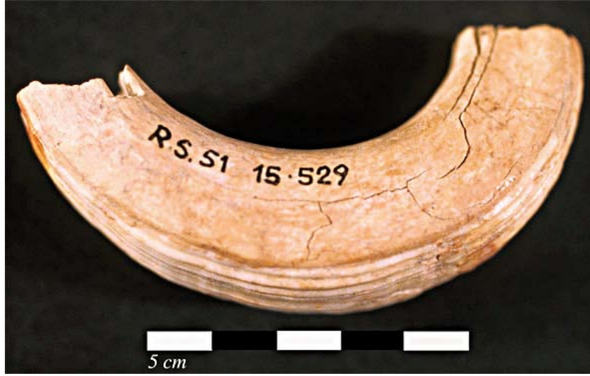
Fig. 45a : Canine de sanglier (RS 15.529, Damas), Palais royal d'Ougarit. الشكل a45 : ناب خنزير بري (RS 15.529, دمشق) قصر أوغاريت الملكي.