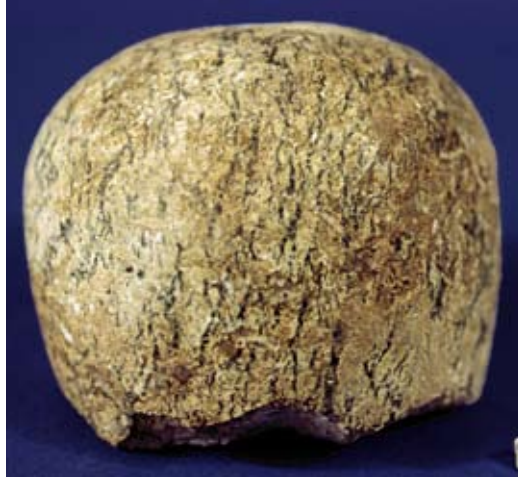
Fig. 47g : Masse d'armes en serpentinite (RS 14.153, Damas), D. 7,45 cm, Ougarit (cliché V. Matoïan et dessin H. David).

الشكل 47g : دبوس من المرمر المرقط (RS 14.153. دمشق). القطر 7,45 سم. أوغاريت (تصوير ف. ماتويان ورسم هـ. دافيد).