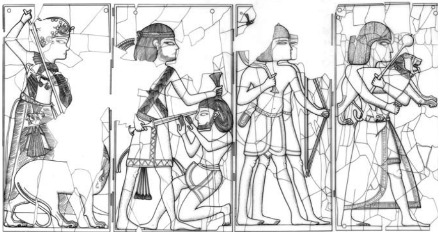
Fig. 47h : Détail du décor du panneau de lit en ivoire du Palais royal d'Ougarit montrant le roi, ses soldats ou ses gardes tenant des armes (dessin J.-P. Lange et H. Morel).

الشكل 47i : سيف من البرونز (RS 18.14. دمشق). «الفناء السابق V» في قصر أوغاريت الملكي (نقلًا عن مجلة Ugaritica III).