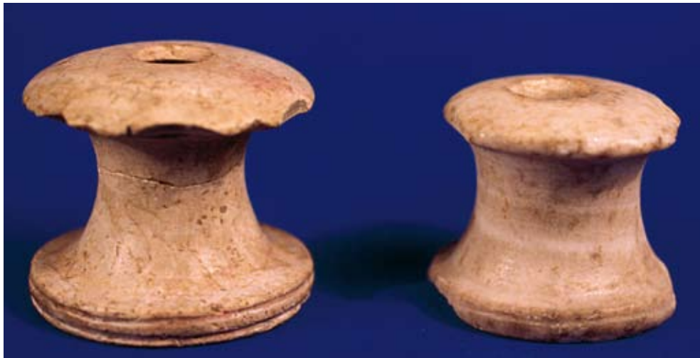
Fig. 47c : Pommeaux de char en travertin (RS 15.295 et RS 16.124, Damas), H. 5,44 cm et 4,81 cm, Palais royal d'Ougarit.

الشكل b47 : الرقيم RS 15.034 (دمشق 3920). الارتفاع 8,6 سم. «المحفوظات الكتابية الشرقية» في قصر أوغاريت الملكي.