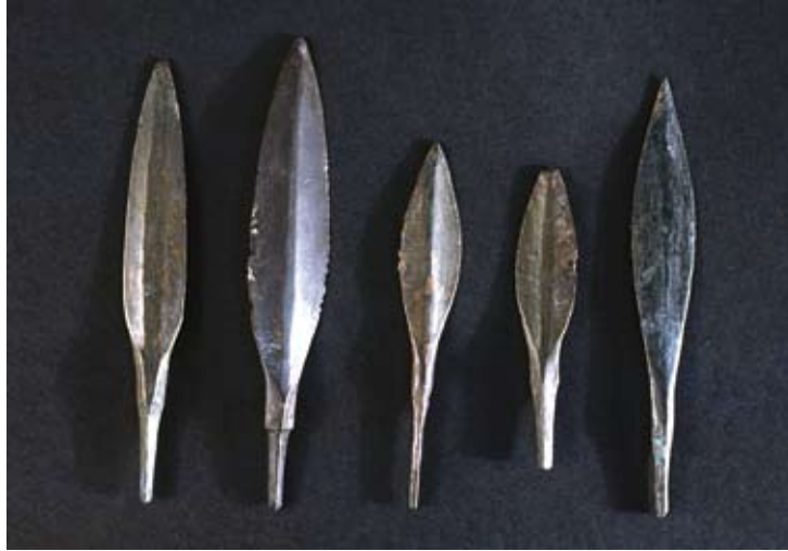
Fig. 47d : Pointes de flèche en bronze (Damas), H. (max.) 11,2 cm, retrouvées au cours de la 16 e campagne dans le Palais royal d'ougarit (cliché V. Matoïan). الشكل d47 : رؤوس سهام من البرونز (دمشق). الارتفاع الأقصى 11,2 سم. عثر عليها أثناء الحملة 16 في قصر أوغاريت الملكي (تصوير ف. ماتويان).