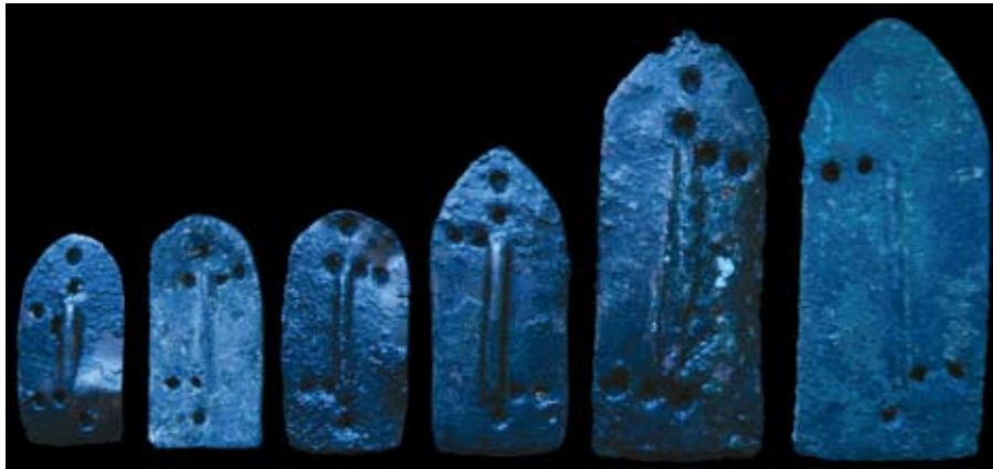
Fig. 47e : Éléments de cuirasse en bronze (Damas), H. max. 8,5 cm, Palais royal d'Ougarit. الشكل e47 : عناصر من درع من البرونز (دمشق). الارتفاع الأكبر 8,5 سم. قصر أوغاريت الملكي.