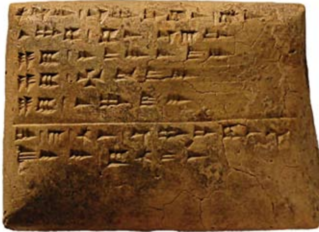
Fig. 47b : Tablette RS 15.034 (Damas 3920), H. 8,6 cm, « Archives Est » du Palais royal d'Ougarit.

الشكل a47 : زخرفة لختم اسطوانتي تبين مشهداً حربيّاً بالعربة (RS 19.190, دمشق 2626). عثر عليه في قطاع القصر في أوغاريت (نقلًا عن أميه 1992).