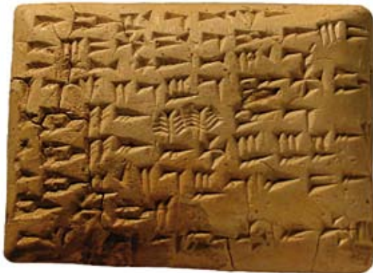
Fig. 47f : Tablette RS 15.083 (Damas 3956), H. 7,1 cm, « Archives Est » du Palais royal d'Ougarit (cliché J.-P. Vita). الشكل f47 : الرقم RS 15.083 (دمشق 3956). الارتفاع 7,1 سم. «المحفوظات الكتابية الشرقية» في قصر أوغاريت الملكي (تصوير ف. ماتويان ورسم هـ. دافيد).