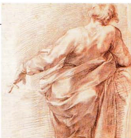
Le Cavalier d'Arpin Homme drapé, vu de dos, appuyé sur le bras droit [détail] Coll. Musée du Louvre, Paris.