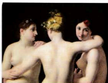
EN COUVERTURE Jean-Baptiste Regnault Les Trois Grâces [détail] 1793 - 1794, huile sur toile, 2,04 x 1,53 m. Coll. Musée du Louvre, Paris. (lire p. 74)